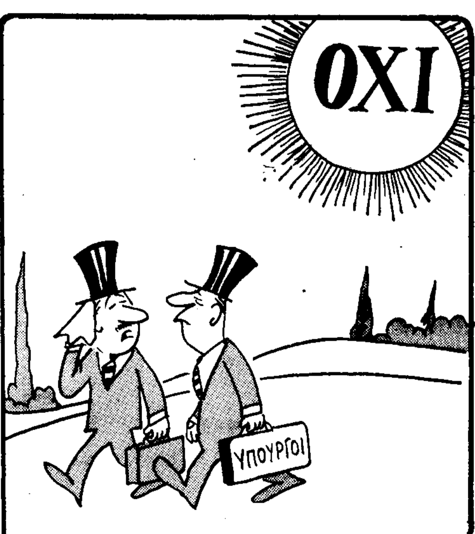
— Ευτυχώς πού άνεκληθήμεν εκ τής υπαίθρου. Θά παιθαίναμε ήλιση!...

το), όπως ύπάρχουν και ύποσχέ- σεις για τόν τρόπο με τόν όποιο προτίθεται να προέδρουν ο κ. Γ. Παπαδοπούλος — άρα άσφαίση, είτε, άκόμωμίστων όθνικών έξου- σιών.